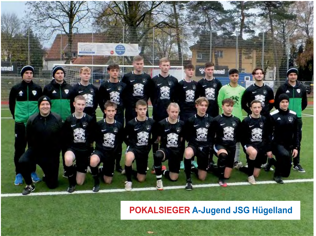
POKALSIEGER A-Jugend JSG Hügelland